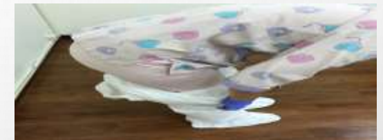
5. 脫防水性連身型防護衣