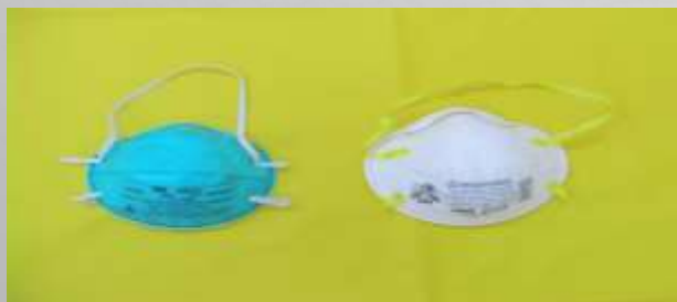
4. N95 口罩