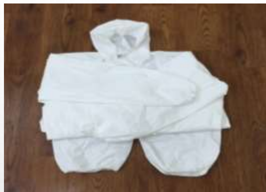
2. 拋棄式防水性 連身型防護衣