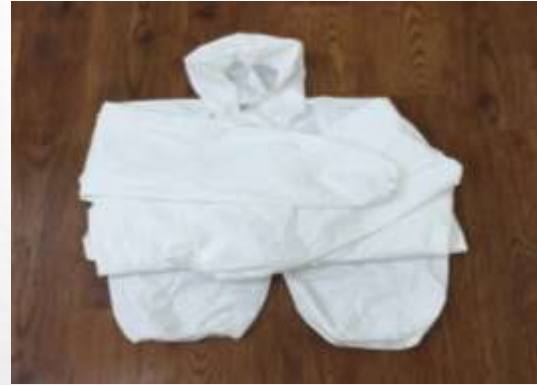
2. 拋棄式防水性 連身型防護衣