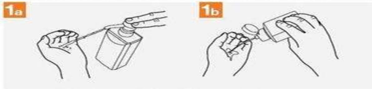
1. 拱起的手掌中放入一手掌的洗手液，並抹勻全手。