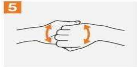
5. 手指的指背對著另一手的掌面，兩手交扣搓洗。