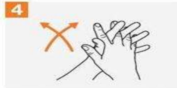
4. 掌對掌，手指交叉搓洗。