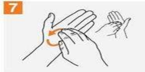
7. 左手掌包住右手指，前前後後旋轉式地搓洗，反之亦然。