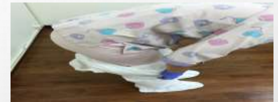
5. 脫防水性連身型防護衣