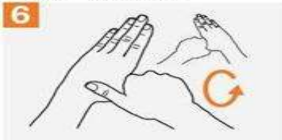
6. 手掌包住左手指，旋轉式搓洗，反之亦然。